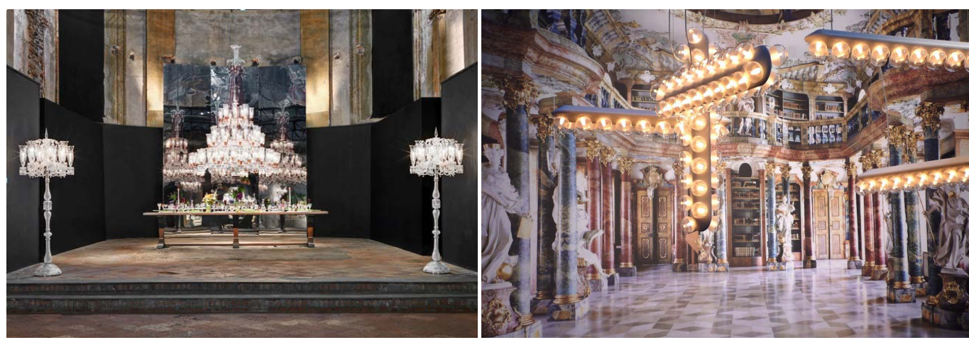
Вассарат в Церкви Сен-Карпофоре, Prop Light дизайнера Бертьяна Пота, Моооi в зоне Тортона

Строгое церковное убранство оттеняет сверкающую роскошь Баккара и фотографий интерьеров барочных зданий, выполненных фотографом Массимо Листри и представленных рядом с коллекцией Моооi.