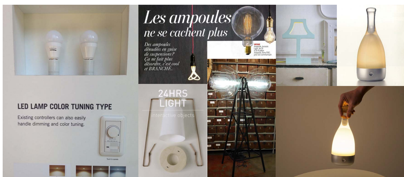
Лампа с функцией настройки цвета Panasonic, разворот «Лампочки больше не прячутся» в Express Styles от 22 апреля, «Отсутствующая лампочка» - Studio Jolanda van Goor «Interactive Design» в зоне Ламbrate, Bottled («В бутылке») от Riu Kozki

Настройка теплого цвета в лампах Эдисона – и светильники, которые можно носить с собой повсюду, как любимые игрушки.