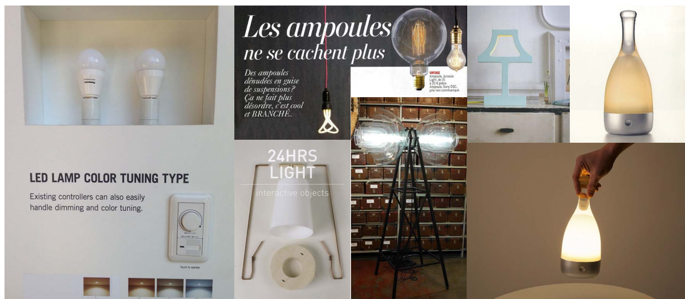
Panasonic Led Lamp Color tuning, Les Ampoules ne se cachent plus , l'Express Styles 22 avril, The Missing Bulb , Studio Jolanda van Goor « Interactive Design » Zona Lambrate, Riu Kozki Botteld

Des recherches de retrouver la lumière chaude des ampoules de Thomas Edison et des lampes « doudou » à emporter partout avec soi.