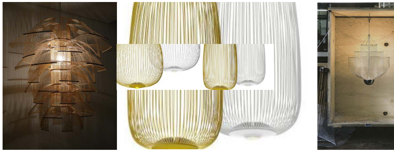
Toshiyuki Tani, The Shadow with the light , Vincente Garcia Jimenez & Cinzia Cumini pour Foscarini, Rick Teglelaart

Des structures au fil pour des effets de vaisseaux suspendus.