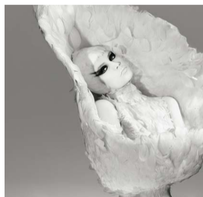
«Тропическая птица» Sisley; Карен Кнорр на Арт Париже-2014; Брошь «Взлет» ювелира Лоренца Баумера; выставка «Райские птицы» в Музее моды Антверпена (март-апрель 2014).