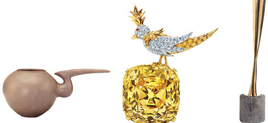
«Птицы» Жоржа Брака; иранский кувшин, 1100 г. до н.э.; желтый бриллиант Тиффани в оправе от Жана Шлюмберже; «Птица» Константина Бранкузи.