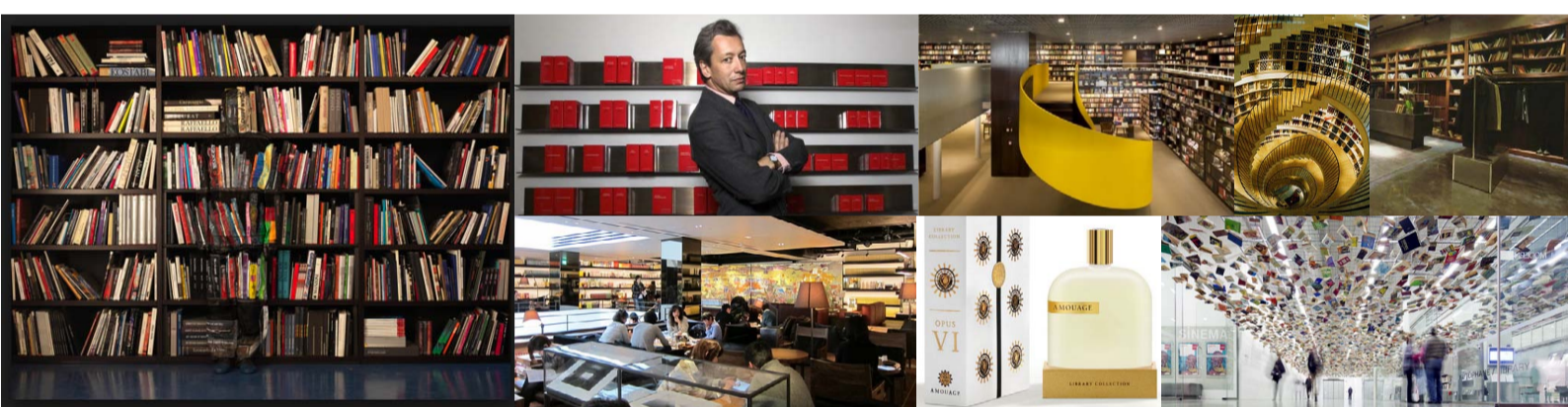
Фотограф Луи Болин – Фредерик Маль – Книжный магазин Tsutaya, Токио – Книжный магазин Traversa, Сан Пауло - Opus VI марки Amouage - L'Intendant, Бордо – Концептуальный магазин Likus, Варшава – Музей современного искусства Istanbul Modern

Книжные стеллажи обладают «пластической» притягательностью. Книга как метафора бесконечности возникает, в частности, в стамбульской инсталляции из «волн» книг, в спиралевидном оформлении Librairie Traversa. «Интендант» Бордо располагает винные сорта по возрастанию качества (и цены). Книги стали также идеальной средой для закамуфлированных автопортретов китайского художника Лиу Болин. Современные библиотеки адаптируются к городскому и комфортному образу жизни – например, жителей «бобо» (буржуа-богема) квартала Дайканияма в Токио. Книга - это также и автор, и издатель, и их творческий диалог: результатом подобного сотрудничества «издателя парфюмов» Фредерика Малля и марки Amouage стали парфюмы Library Collection и терпкий, цветочный и яркий Opus .