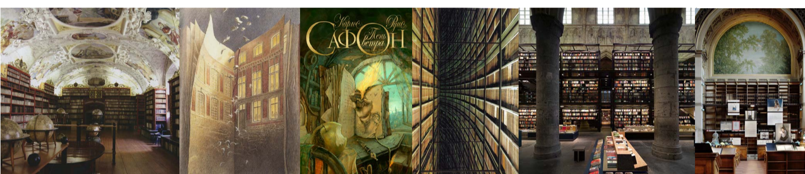
Страговская библиотека, Прага – Шуитен и Петерс, «Архивист» – Карлос Руис Сафон, «Тень ветра» – Николя Гроспьер, «Библиотечный проект» – Книжный магазин Selexuz, Маастрихт – Софи Каль, выставка «Берегите себя», BNE, Париж

Рассказ Борхеса «Вавилонская библиотека» обращается к мифу места хранения всемирного знания. Библиотека предстает как бесконечность пространства как физического (своего рода архитектурный абсолют), так и ментального - знаний настоящего, прошлого и будущего. Это отдельная вселенная, головокружительный мир, к которому есть ключ лишь у монаха. Библиотека Страговского монастыря в Праге, в сердце Центральной Европы, хранит в себе более чем пятивековые знания. Серия графических романов бельгийских соавторов, архитектора Франсуа Шуитена и рисовальщика Бенуа Петерса, «Туманные города» развивается также вокруг темы книги. Писатель Карлос Руис Сафон выстроил готическое эпическое повествование вокруг популяризации книг в Барселоне в начале XX века. Фотограф Николя Кроспьер ищет вдохновение в головокружительной бесконечности книжных полок. Библиотека может быть в буквальном смысле храмом знаний, - как, например, в Маастрихте, - но может являться и местом интимной встречи тет-а-тет с текстом, словом: такой она представляла в письмах художницы Софи Каль на выставке в Национальной французской библиотеке в 2008 году.