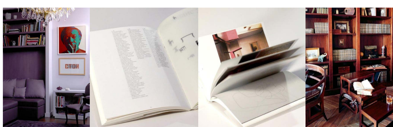
Брижит Сабби: апартаменты (деталь) - Книга о мире Брижит Сабби «Черты очерчивать чертог» - Библиотека (деталь).

Книги всегда присутствуют в пространствах, создаваемых Брижит Сабби для своих клиентов. Источники ее вдохновения сложились в сборник, который вышел в печать на французском и русском языках в 2012 году.