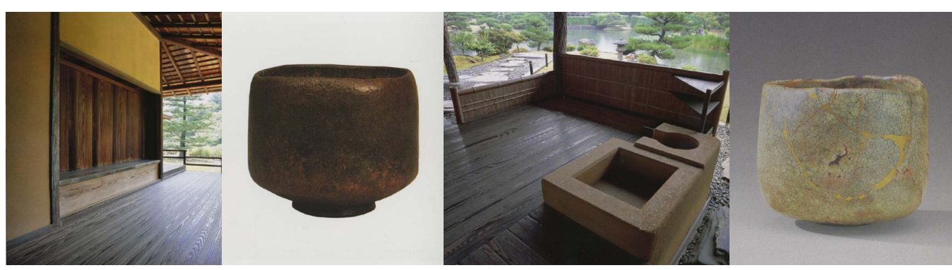
Вилла Кацура (чайный павильон и кухня) – чашка Раку керамиста и мастера чайной церемонии Хонами Коэцу (1620), Музей Гимэ, Париж.

Концепт ваби-саби – сердце японской эстетики. Ваби, или скромная простота, - это «утонченность, переданная через простоту, естественная, неподдельная элегантность, благородство без манерности»*; саби - это патина времени, а также способность полностью отдаться ностальгии и романтическому чувству перед проявлениями Природы и проходящего Времени. Искусство, в котором проявляется концепт ваби-саби, - искусство раку, появление которого относят к XVI веку: в Киото знаменитый мастер чайной церемонии изготавливал вручную уникальную чайную посуду из глины, обожженной на медленном огне. Столетие спустя принципы ваби-саби воплотились в вилле Кацура, ставшей излюбленным местом наблюдения за природой - особенно в те ночи, когда луна играла струями фонтанов, - для императора и его семьи. В XX веке вилла стала местом паломничества архитекторов-модернистов, восхищавшихся точностью соотношения объемов, эргономией материалов, а также простотой и эффектностью ее планировки.