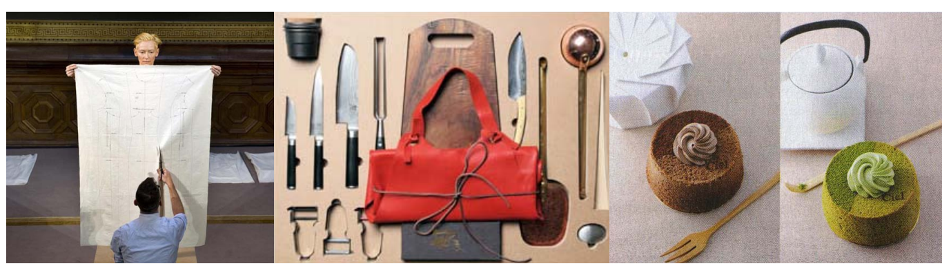
Eternity Dress / Оливье Сайяр и Тильда Свинтон - La Malle W Trousseau – Пирожное «Ангел», Patisserie Ciel (Париж)

Тем временем новые японские десерты изысканнейших вкусов приятно будоражат обоняние Парижа - как и приближающееся дыхание весны.