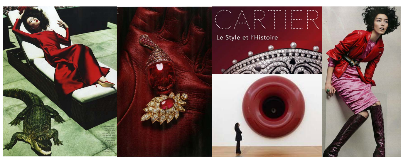
Китайский Vogue, российский Vogue, выставка Cartier в Grand Palais (Париж), Аниш Капур в Стамбуле, «Цвет времени» в Elle.

В то время как интенсивный красный правит в мире зимы и роскоши, более легкие, светлые оттенки и варианты «модного красного» поддерживаются влиянием Азии (в особенности Китая), которая давно привержена этому цвету и использует его вне зависимости от сезона и в более смелых комбинациях, как, например, варианты «весеннего и летнего красного» в последнем Elle.