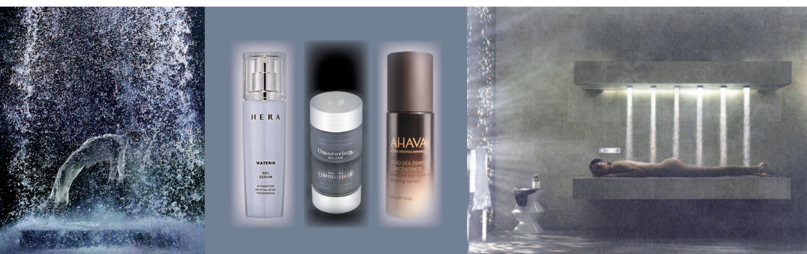
Билл Виола, кадр из видео. Косметика Héra, Omorovicza, Ahava. Горизонтальный душ от Dornbracht

В видео-работах Билла Виолы вода предстает как субстанция, разделяющая тело и душу. В мире спа получает популярность процедура «горизонтальный душ», расслабляющая и тонизирующая одновременно. Косметические средства на базе минеральных вод давно и заслуженно в почете: например, марки «Ahava» на основе минералов Мертвого моря, «Omorovicza» с использованием венгерских лечебных грязей, увлажняющая сыворотка корейского бренда «Hera» - эффект стоит того, чтобы отправиться за ней даже в Сеул!