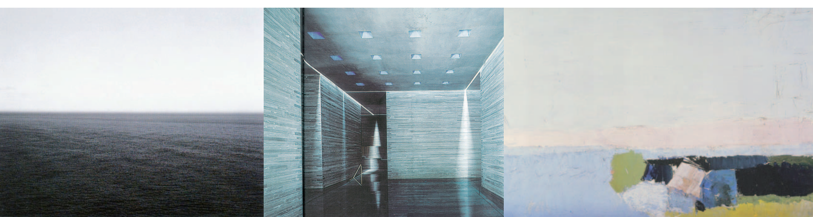
Морские ландшафты Хироши Сугимото. Петер Цумтор, Здание терм на курорте Вальс. Николя де Сталь, «Пляж».

Фотографии Хироши Сугимото представляют взору медитативные горизонты самых различных морей мира: здесь совмещаются в глубоком, но изменчивом спокойствии ян синего неба и инь темных вод. Пейзажи Николя де Сталья акцентируют горизонталь и средиземноморскую синеву в предзакатное время дня. Термы Петера Цумтора в швейцарских Альпах дышат исполненной спокойствия атмосферой, освещаемые синевой стен из кварцита. Этот камень с просвечивающими жилками добывается здесь же, в богатом термальными источниками регионе Вальс.